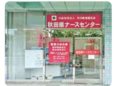
アトリオン1F 入口は広小路側です。