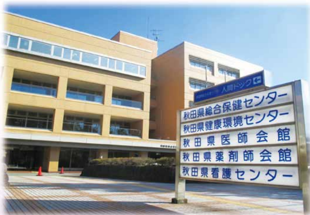
秋田県看護センター（秋田県総合保健センター5F）