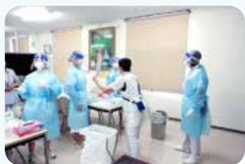
ふれあい看護体験