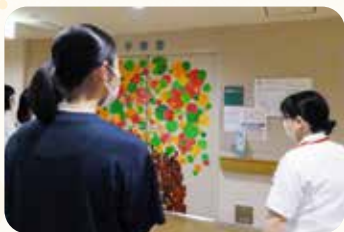
ふれあい看護体験