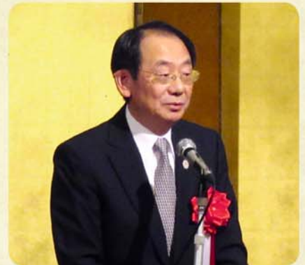
秋田市市長 穂積 志 氏