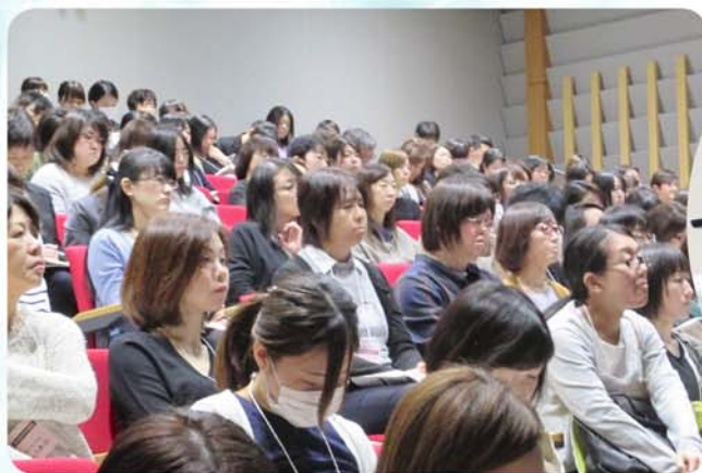
講演でのひとコマ