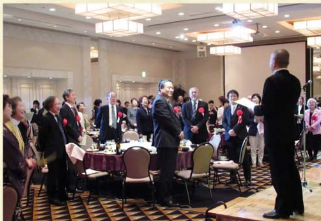
秋田県民歌大合唱