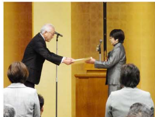
知事表彰代表者授与